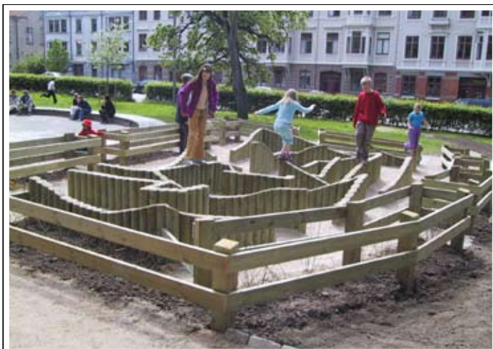
Söderlingska parken där gammalt och nytt möts.