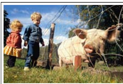
Djurlek och bygglek från 70-talet.

1960-1975: Under denna tid byggs de nya storskaliga stadsdelarna i Angered, Frölunda, Biskopsgården och Bergsjön. I dessa läggs stor vikt vid barns och ungdomars miljö. Förutom stora och välutrustade lekplatser bygger man både fritidsgårdar och parklekshus i dessa områden. Där finns personal och de har aktiviteter både dag- och kvällstid.