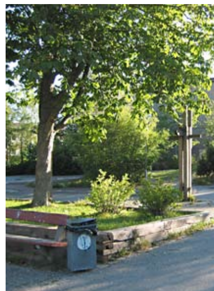
Exempel på gamla sliperssargar.

En väl underhållen plats ökar lekvärdet och minskar risken för skadegörelse.