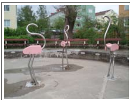
Skulptural vattenlek - flamingor i Källtorp.