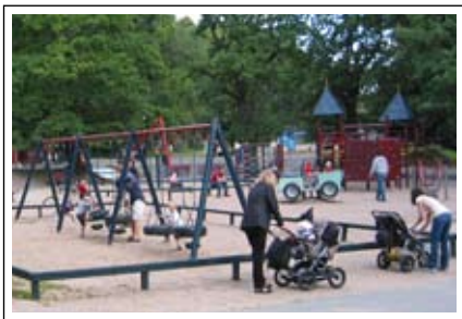
Plikta i Slottsskogen är en typisk utflyktslekplats med besökare från hela staden.

Några av stadens lekplatser kan få ett innehåll som gör att de, liksom t.ex. Plikta i Slottsskogen, blir utflyktsmål. De ligger lämpligen i eller vid något större parkområde och är geografiskt väl spridda.