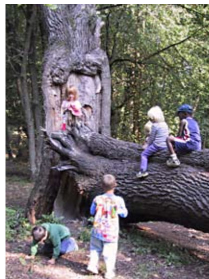
Krokslättsparken — en lekplats som "bara blev".

Genom den forskning om barns utelek, som skett under 80- och 90-talet vet vi att den traditionella leken på välplanerade och välutrustade lekplatser bara tillfredställer en del av barnens lekbehov. Den andra, friare och mer kreativa leken, äger rum i naturen och på restytor med mycket löst material (stenar, stockar, tunnor, plankor). Ett bra sätt att tillgodosätta båda dessa behov, är att placera lekplatser i eller nära naturen.